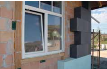
► izolacja cokołu