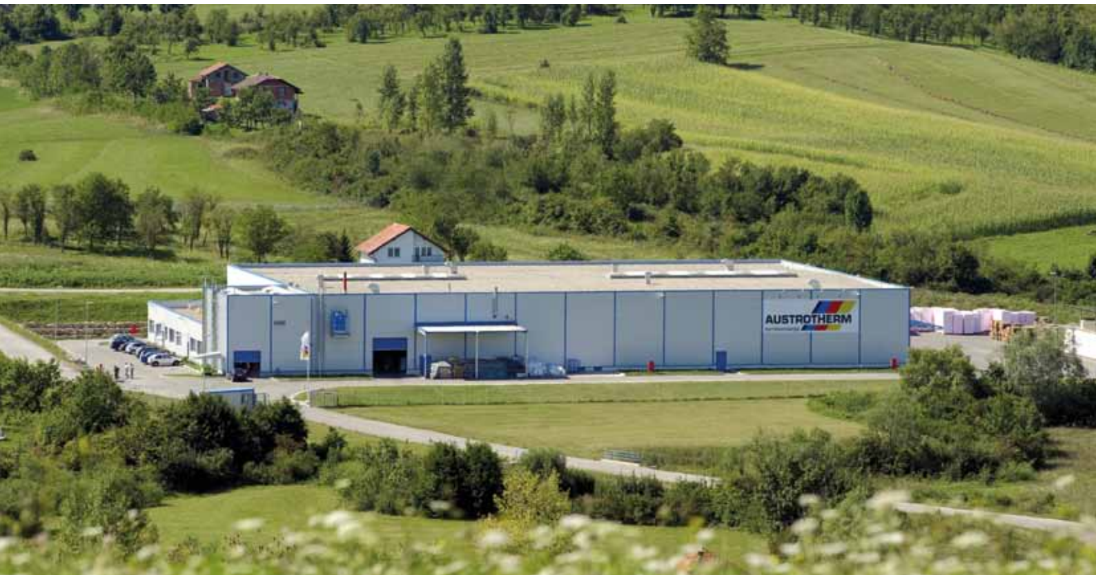
Fabryka Austrotherm w mieście Bihać.

Bośnia i Hercegowina znana jest głównie z najnowszej tragicznej historii. Obecnie turyści ze zdumieniem odkrywają ten kraj jako atrakcyjny kierunek swoich wypraw. Bogata historia, różnorodność kultur oraz piękne górskie pejzaże przyciągają spragnionych unikalnych wrażeń.