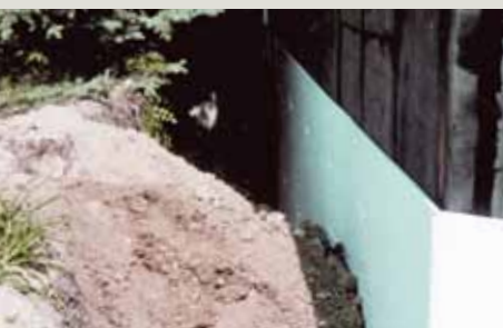
► izolacja ścian fundamentów

Płyty styropianowe Austrotherm EPS 035 EXPERT produkowane są z surowca, którego właściwości umożliwiają wyprodukowanie płyt EPS o obniżonej chłonności wody. Sposób ich produkcji polega na tym, że każda z płyt jest formowana oddzielnie. Dzięki indywidualnemu procesowi kształtowania płyt uzyskuje się: