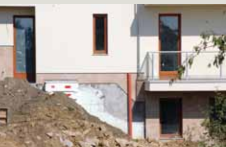
► izolacja ścian piwnic